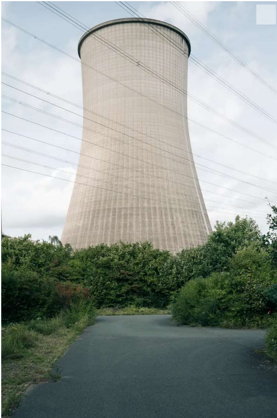
Kühlturm des Ibbenbürener Steinkohlekraftwerks: Die Außenhaut steckt voller Asbest

Als das Kraftwerk Anfang der Achtzigerjahre gebaut wurde, war die Gefahr von Asbest noch kaum bekannt. Mittlerweile wird das Zeug aber vom Umweltbundesamt als »eindeutig krebserregender Stoff« geführt. Es kann sich in feine Fasern zerteilen, leicht eingeatmet werden und die Lunge erheblich verletzen. Deswegen müssen alle Teile, in denen der karzinogene Müll steckt, vor der Sprengung ausgebaut und entsorgt werden. In Ibbenbüren sind das riesige Mengen Sondermüll, was auch daran liegt, dass das Kraftwerk wegen seiner erhöhten Lage besonderen Schallschutzbestimmungen unterlag – und Asbestplatten gut geeignet sind, um Lärm zu minimieren.