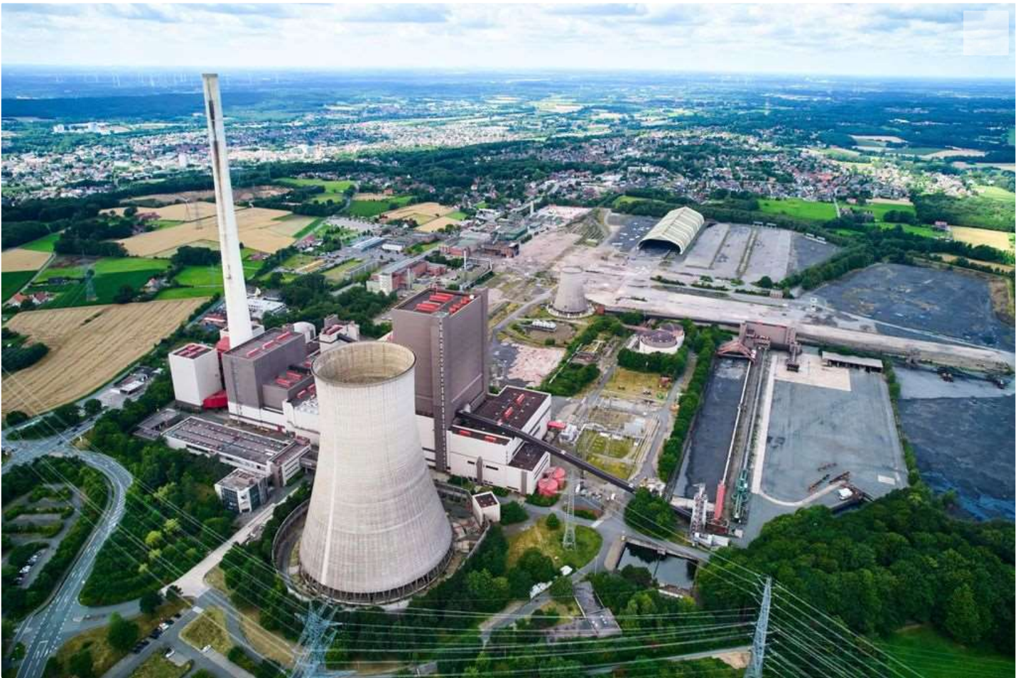
Ehemaliges Kohlekraftwerk Ibbenbüren: Überall droht die Freisetzung giftiger Stoffe